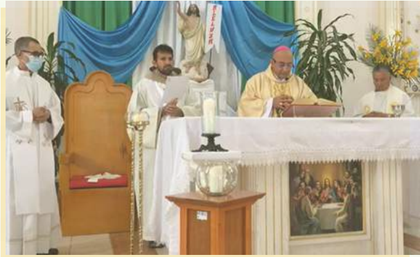
Haz clic en la imagen para más información