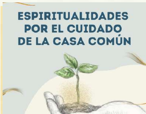
Haz clic en la imagen para más información